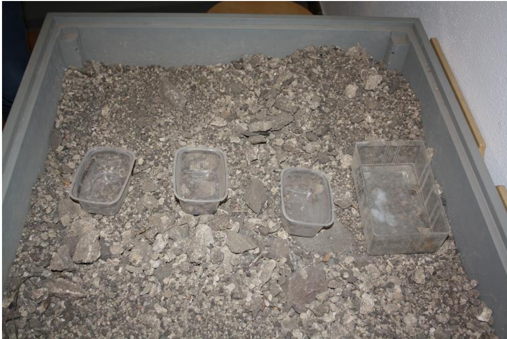
Der findes et lille bord hvor man kan prøve at finde genstand.