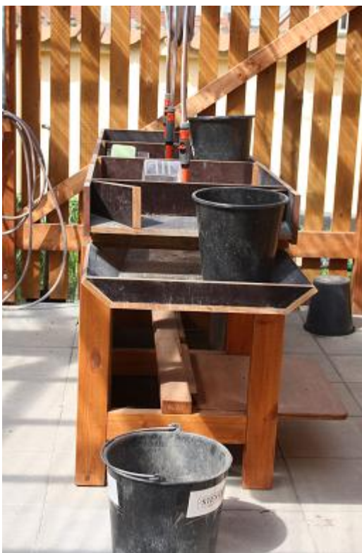
Udendørs har man et anlæg hvor man kan søge med metaldetektor og solde jord. Det inspireredes os til at lave en udgravning i ArkæoLAB hvor man skal bruge metaldetektor.