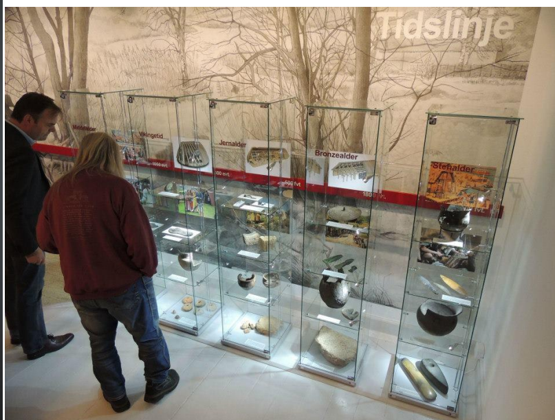
Aktivitetens rummets flotte Kronologiskabet (tv.) som inspirerede os til at lave en tidslinje i ArkæoLAB(th.)