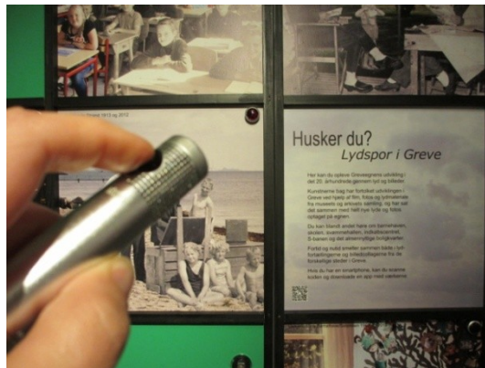
Lyttevæggen med lydværker formidlet i høretelefoner. Når man ”skyder” på billedet begynder lyden at spille.