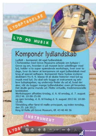
To koncentrerede drenge komponerer lydlandskaber på workshopens anden dag.