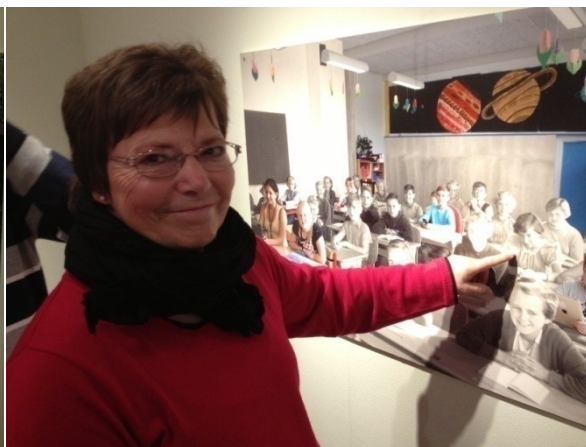
En af de besøgende i udstillingen udpeger sig selv på tidsbilledet fra skolen