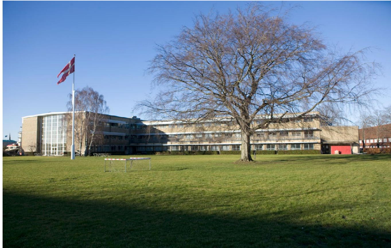
Søværnets officersskole (1939). Hovedbygningen og omgivelserne er tænkt og anlagt som et samlet hele. Det runde cykelskur i beton og den støbte baldakin har høj arkitektonisk værdi. Det hele anlæg er et smukt eksempel på tidens modernistiske arkitekturholdninger.

tende den brostens- og asfaltbelagte mole samt det areal, der støder op til Batteriet Sixtus, Marinekaserneanlægget og Planbygningen herunder stopbommen fra Bedding 1. På Nyholm er detaljerne lige så vigtige som bygninger og anlæg. Det er det samlede kulturmiljø, der sikrer de bærende værdier. Det er afgørende, fordi det ofte er netop disse elementer man har fjernet fra en række andre havneområder, og hermed frataget dem en helt central del af stedets identitet og autenticitet.