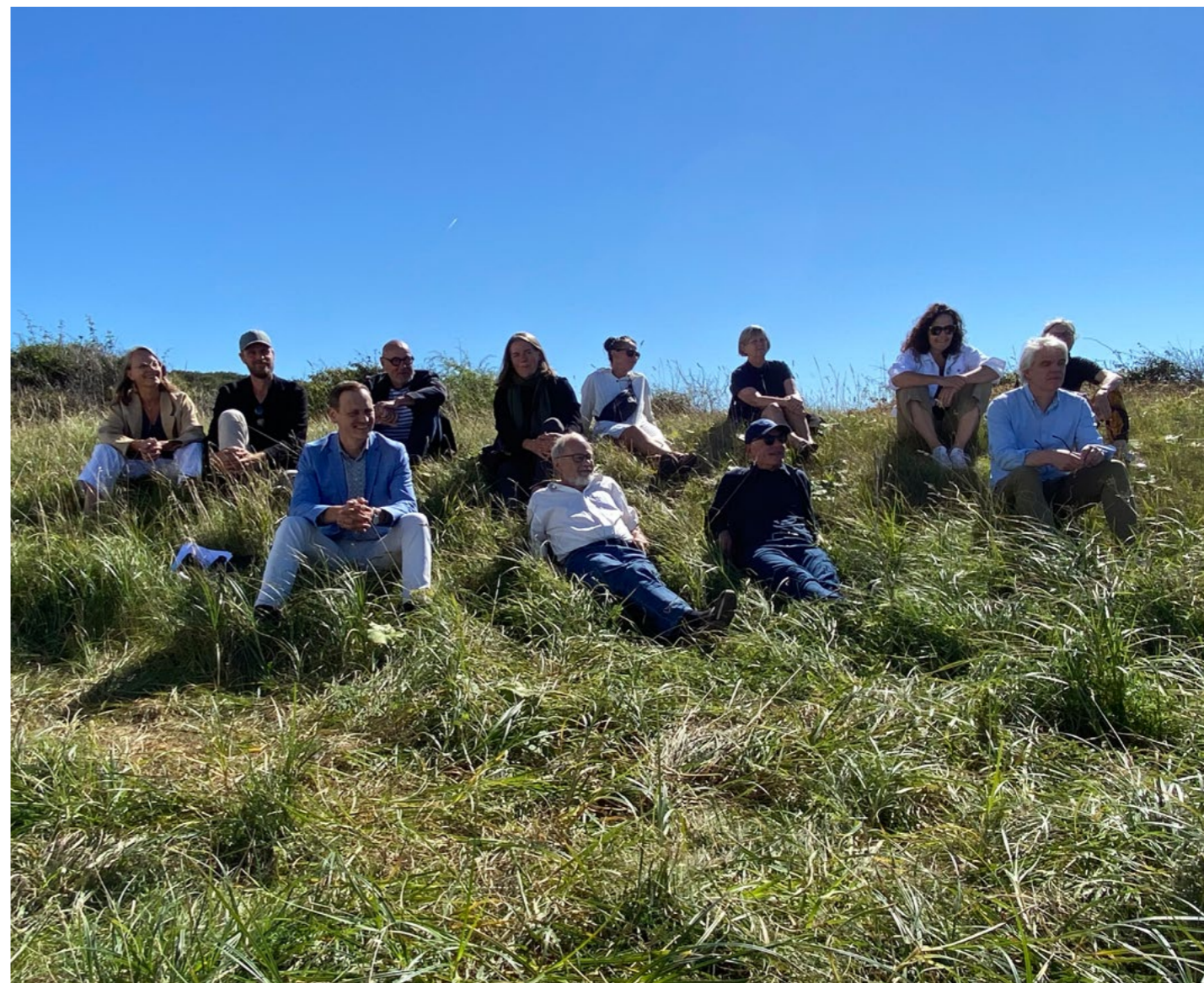
Det Særlige Bygningssyn på tur til Nordjylland 1. september 2022.