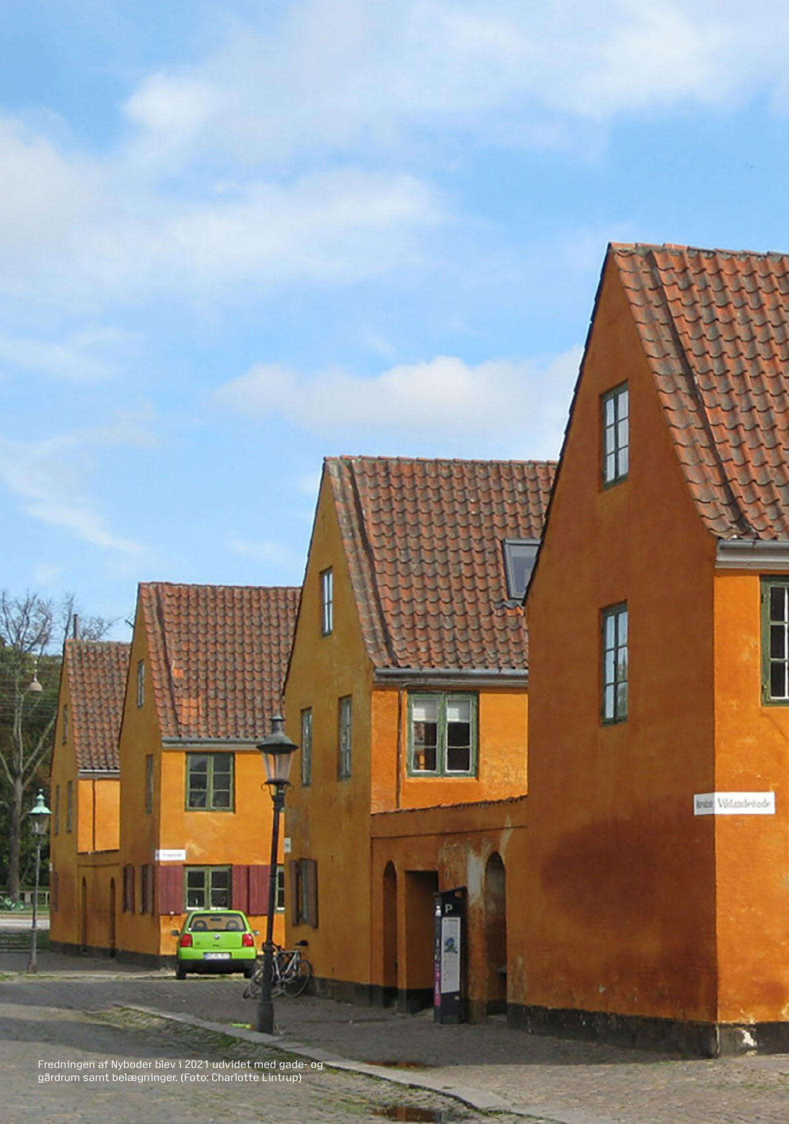
Fredningen af Nyboder blev i 2021 udvidet med gade- og gårdrum samt belægnings.