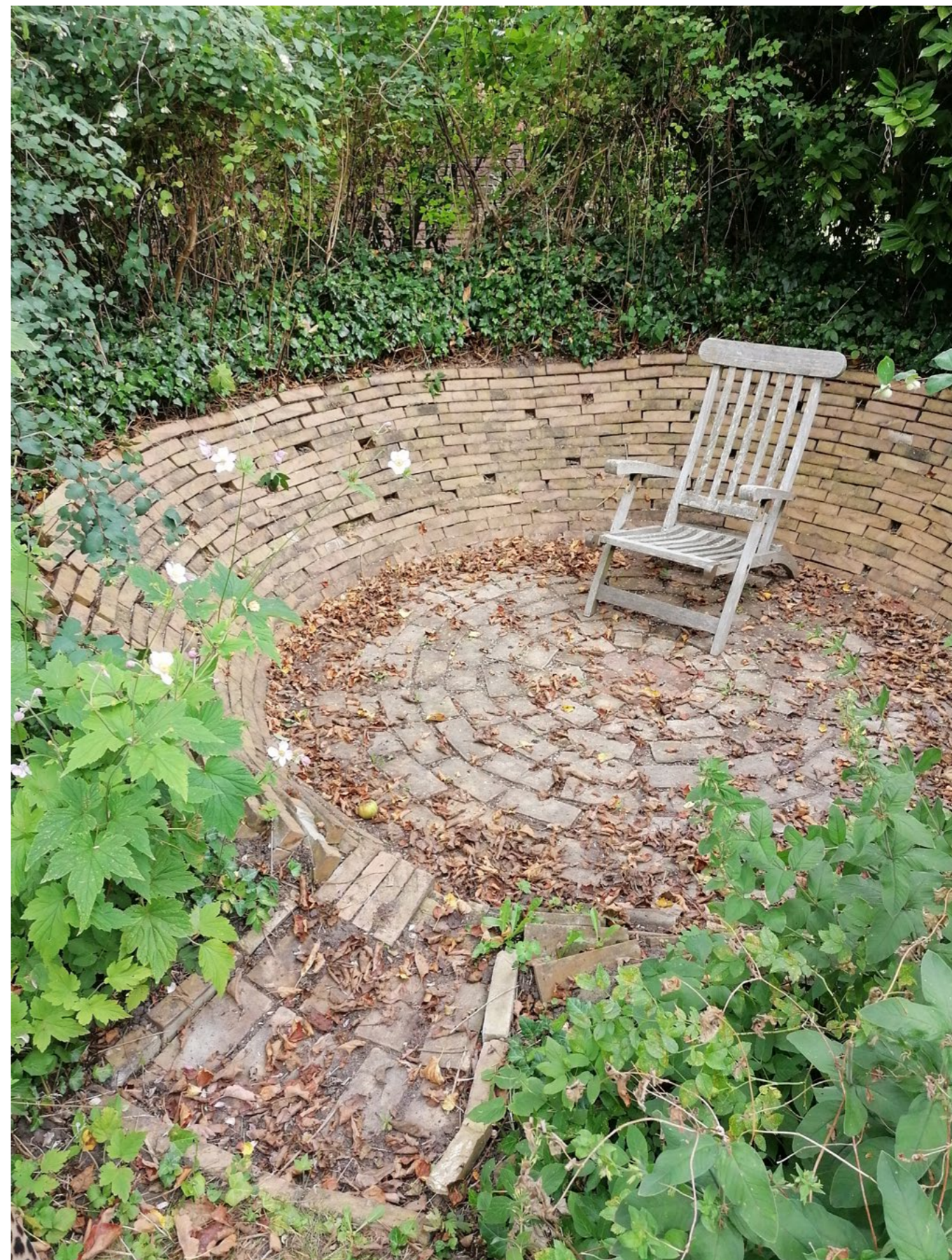
Villa og have på Ådalsvej 5, Vanløse, Københavns Kommune blev fredet i 2022. Inklusiv havens "solgryde" i gule tegl.

Hvis vi vil sikre, at også vi nu og i fremtiden kan opleve bygninger og miljøer, der favner hele det danske samfunds historie, må vi lære af sagerne om slagterboderne, Lorry og Dæmpegård. En del ville kunne reddes gennem en gradueret fredning, hvor den eller de lavere kategorier koncentrerer sig om bygningens værdier i det ydre. Men en gradueret fredning alene vil ikke løse alle problemer. Muligheden for at beskytte helheder af national værdi vil være af central betydning sammen med en præcis definition af begrebet 'kulturhistoriske fredningsværdier'.