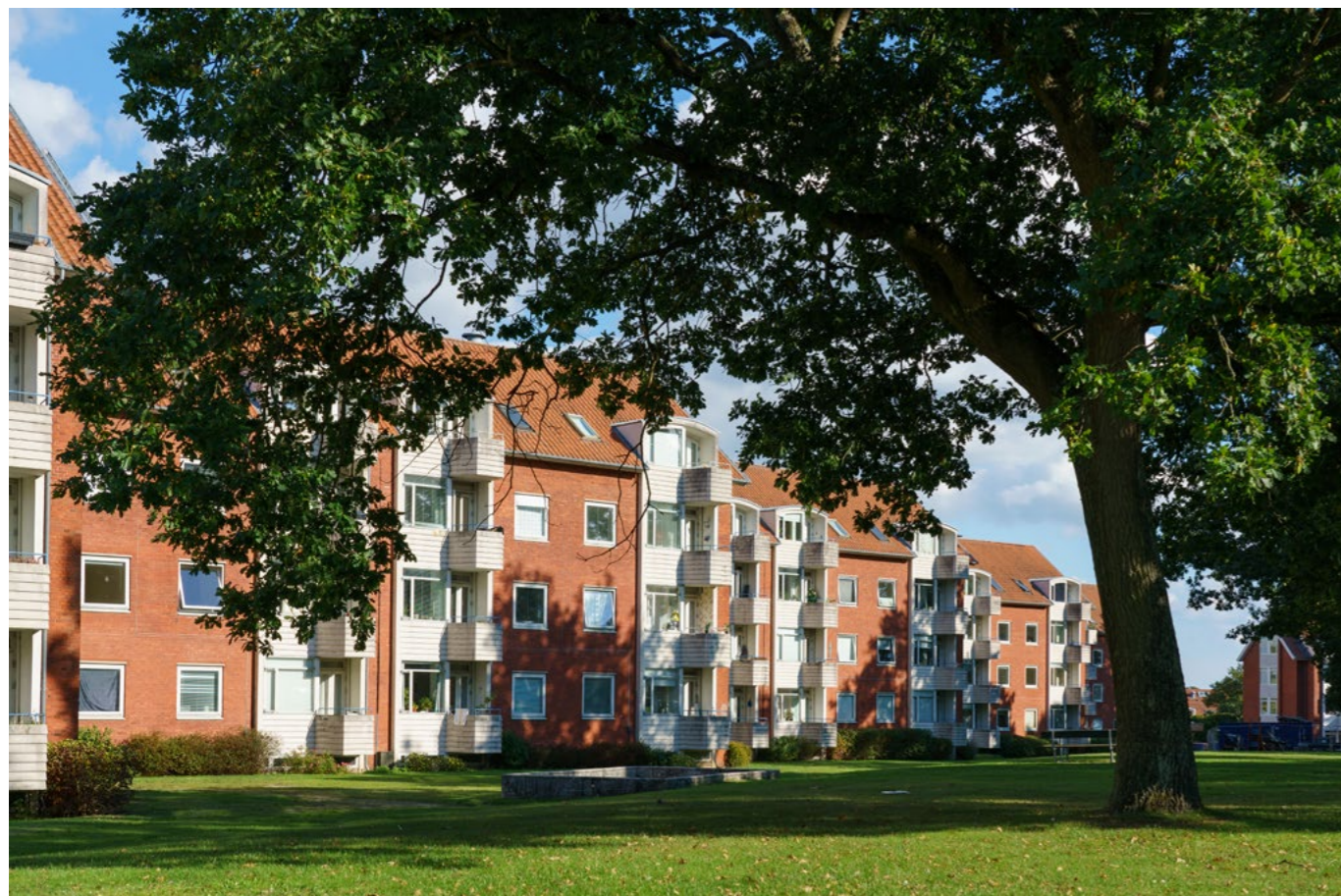
Boligforeningsbyggerierne fra 1950'erne rummer store kvaliteter, og mange beboere føler en stolthed over kvarteret.

Forudsætningen for at sikre udbredelsen af den nye fredningsstrategi er at udarbejde en plan for udbredelse af strategien – og et formidlingsmateriale, som kan distribueres og bruges til formålet. Og at man kan opleve og identificere sig med lokale fyrtårne, som gode eksempler på fredede bygninger og anlæg.