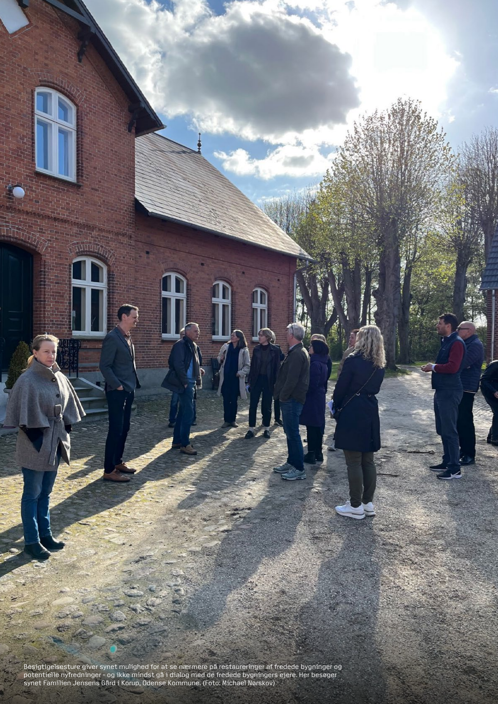
Besigtigelsesture giver synet mulighed for at se nærmere på restaureringer af fredede bygninger og potentielle nyfredninger - og ikke mindst gå i dialog med de fredede bygningers ejere. Her besøger synet Familien Jensens Gård i Korup, Odense Kommune.