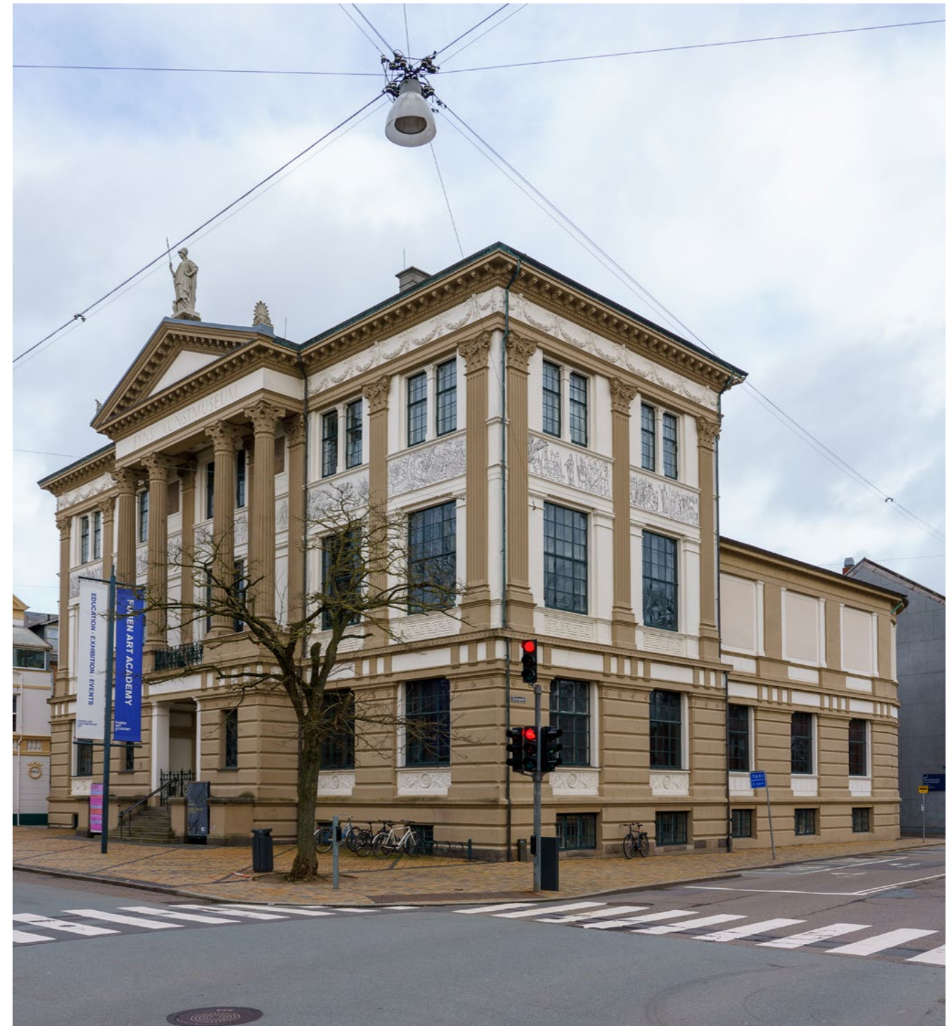
Fyns Kunstmuseum i Odense fredet 2020. Opført som Stiftsmuseum for Fyn i 1885 i historicistisk stil stærkt inspireret af klassicismen. Mellem pilastrene friser med sagamotiver og på toppen troner Athene over lærdommens tempel.

De to største fredningssager i perioden 2019-23 er Nyholm, der teknisk set er en fredningsudvidelse, da en række ældre bygninger i området var fredet tidligere som en del af fredningssagen Holmen, samt Aarhus Universitet som et landskabsarkitektonisk værk.