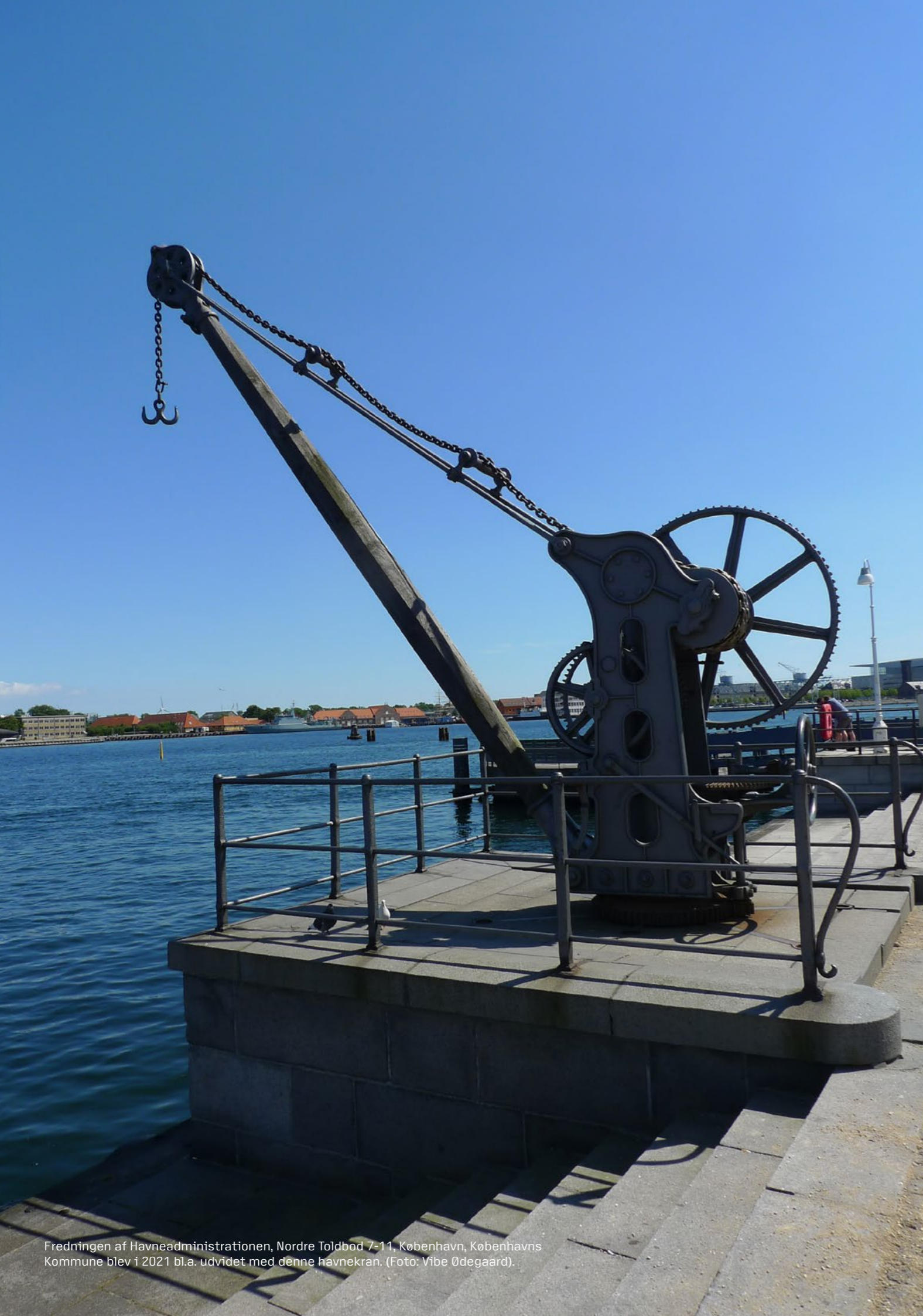
Fredningen af Havneadministrationen, Nordre Toldbod 7-11, København, Københavns Kommune blev i 2021 bl.a. udvidet med denne havnekran.