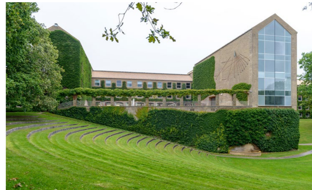
Aulaen i Universitetsparkens nordlige ende er den eneste bygning, der stikker ud fra det enkle skema, og fungerer som ankerpunkt for flere sigtelinjer i parken.

De bedste danske fortolkninger af den internationale modernisme er båret af tanker om demokratisering og fællesskab. Det viser sig i den nøgterne og næsten antimonumentale stil – kun fællessalen Aulaen på toppen af bakken har fået lov at skille sig ud. Aarhus Universitet er skabt til fællesskab og møder mellem studerende, undervisere og fag. Seminarlokaler, hvor undervisere og studerende kan mødes i øjenhøjde i fælles dialog. Kollegier med fælles køkkener forener studerende på tværs af fag. Professorer og studerende spiser i de samme kantiner. Og så er der fælles mødelokaler, der understøtter studiemiljøet og foreningslivet. Det største og grundlæggende mødested er selvfølgelig parken, der inviterer til gåture og ophold.