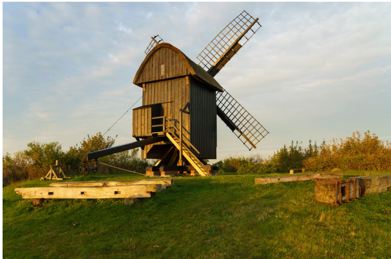
Brundby Stubmølle på Samsø blev bygget i begyndelsen af 1600-tallet. Den er flyttet to gange og har malet mel i mere end 300 år og holdt kontinuerligt ved lige i 400 år.

Interessen for bygningskultur og fredede bygninger har i de senere år fået en ny dimension, for de fredede bygninger minder os om at god arkitektur og gennemtænkt byggeri har en meget lang holdbarhed. De ældre fredede bygninger er udtryk for en traditionel byggeskik, der er udviklet over århundreder, og som rummer en stor tavs viden om materialer, byggeteknikker, ressourcebevidsthed og måder at vedligeholde på. Disse bygninger kan inspirere nutiden til at bygge mere langsigtet og bæredygtigt. Tilsvarende kan fredninger være med til at fremhæve kvaliteterne ved det bedste af det 20. århundredes byggeri, nemlig den store interesse for at skabe rum for stærke fællesskaber, at integrere det grønne element i byggeriet som grundlag for livskvalitet og at kombinere mange behov i en funktionel planlægning. De bedste eksempler er bæredygtige i social forstand, og rummer en anerkendelse af det eksisterende byggeris kvaliteter, der langt overgår hovedløst nybyggeri.