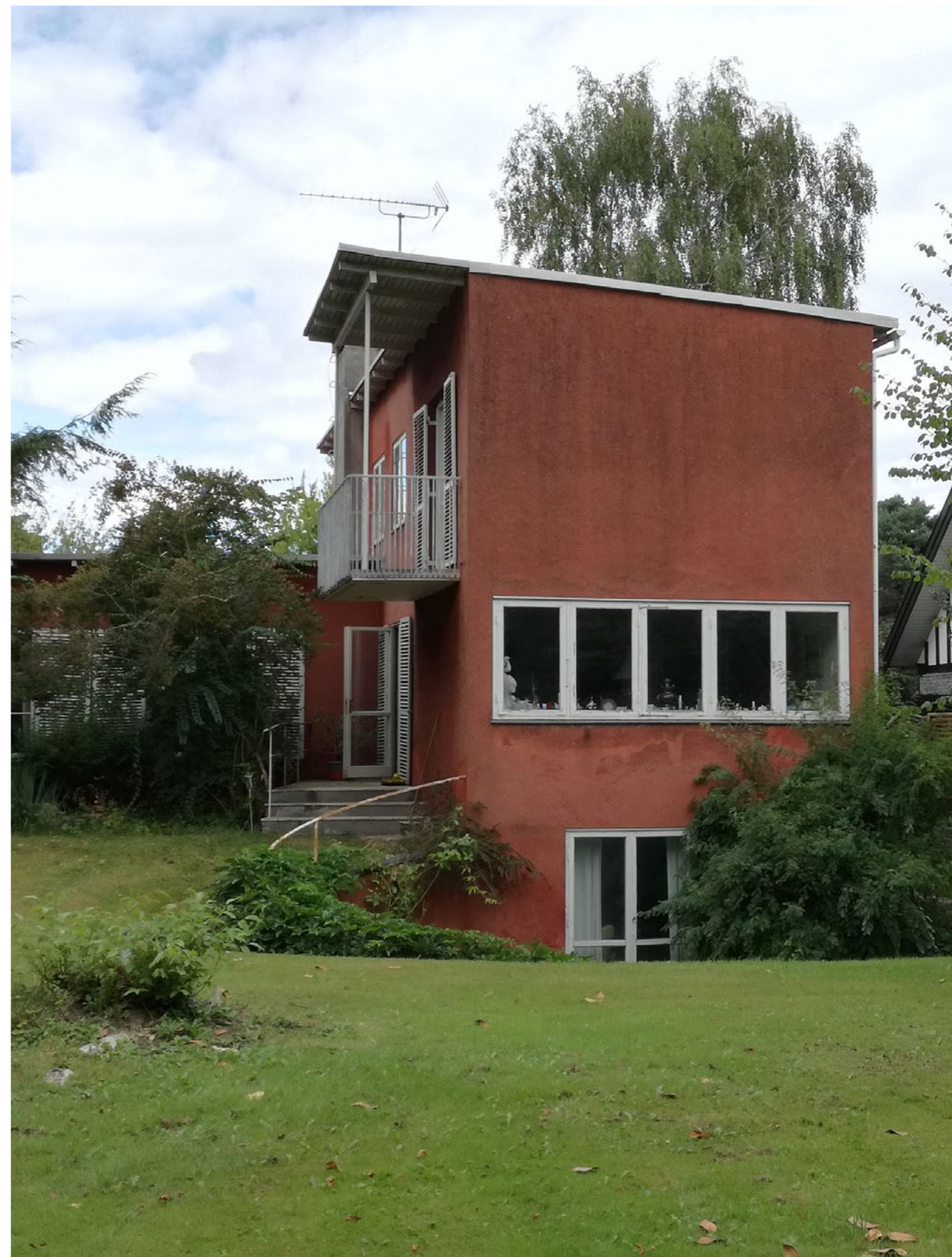
Villa og have på Tuborgvej 99, Gentofte Kommune blev fredet i 2022.