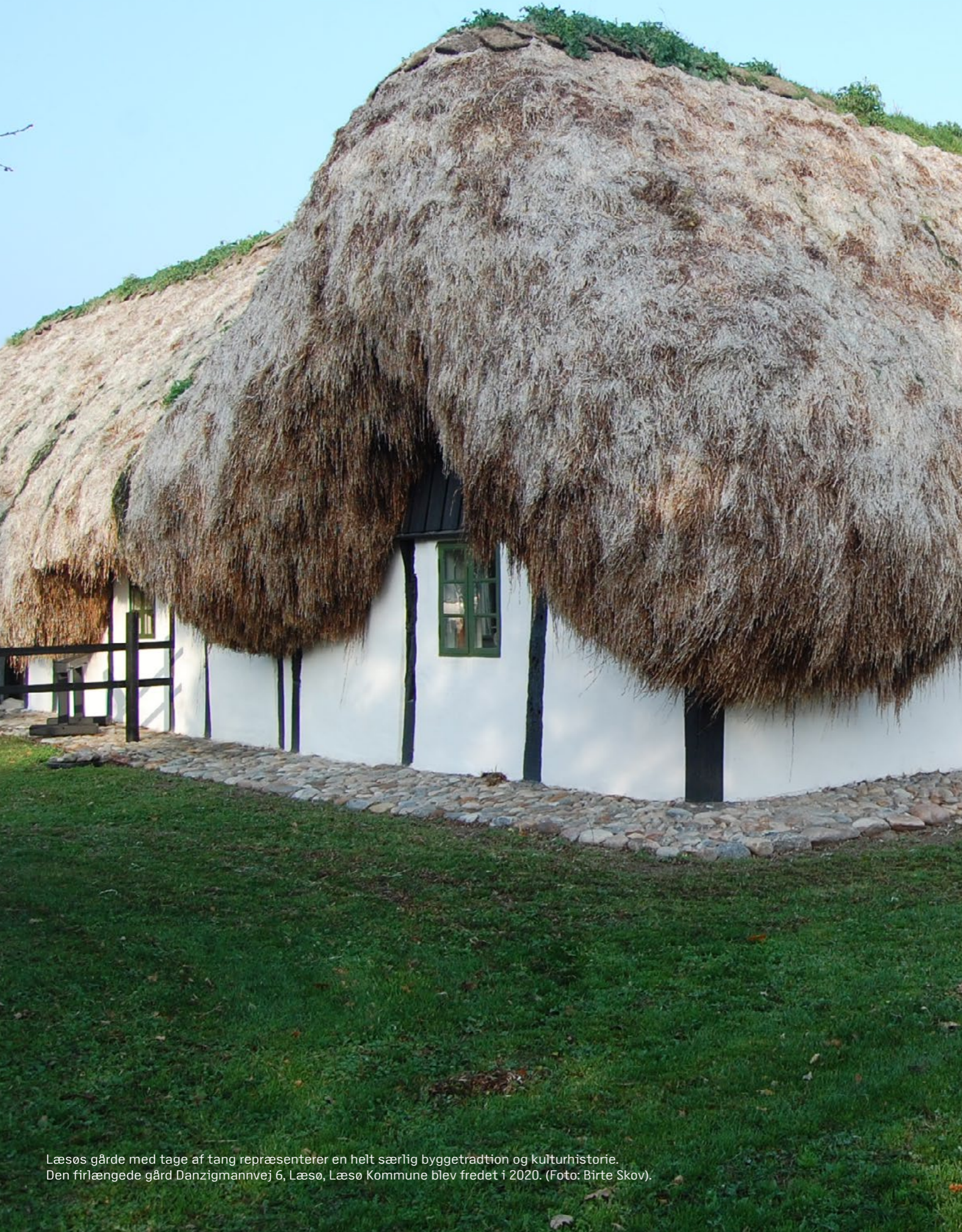
Læsøs gårde med tage af tang repræsenterer en helt særlig byggetradition og kulturhistorie. Den firlængede gård Danzigmannvej 6, Læsø, Læsø Kommune blev fredet i 2020. (Foto: Birte Skov).