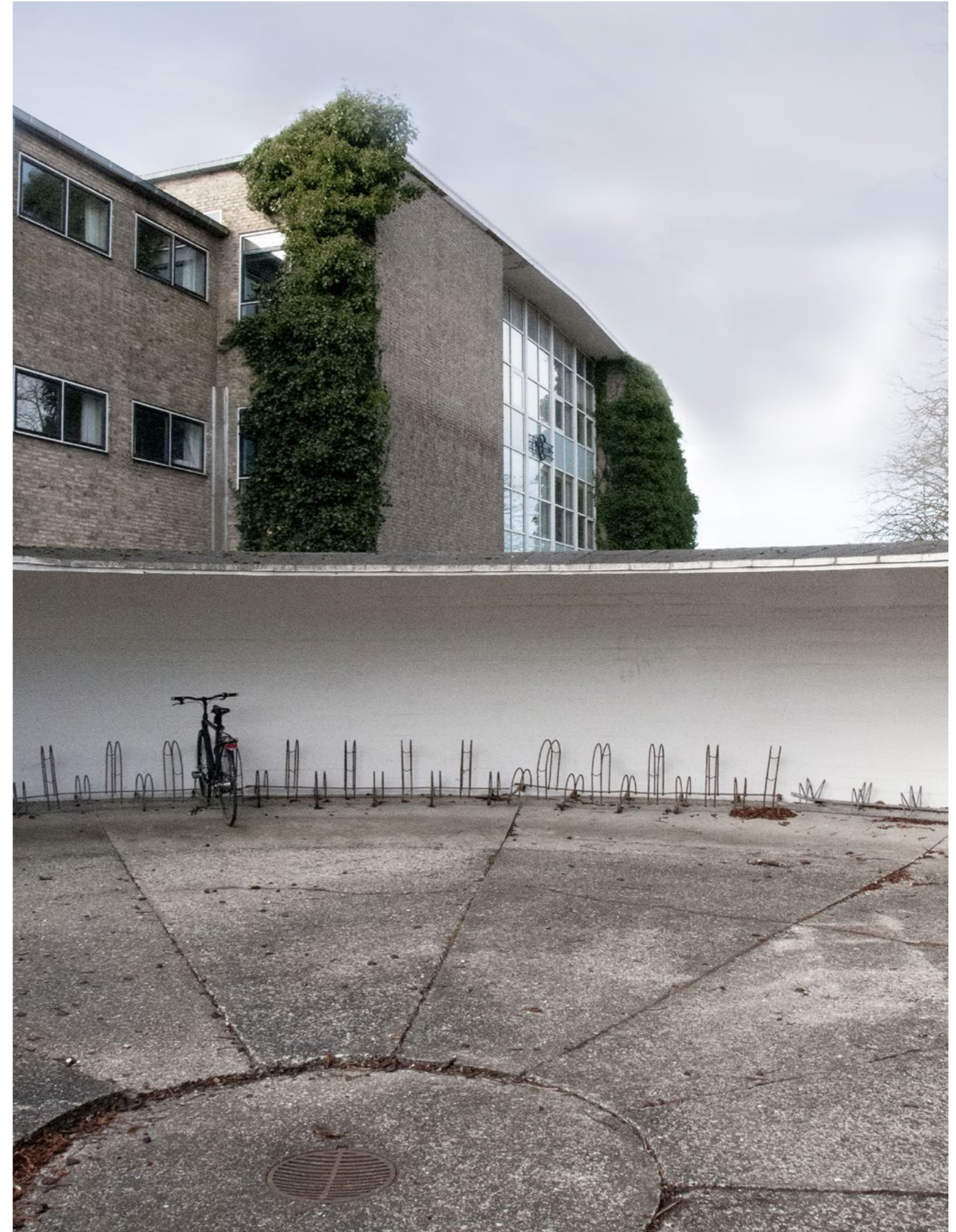
Også cykelskuret til Søværnets Officersskole blev fredet i 2022 i forbindelse med fredningsudvidelsen af Holmen i København. Den runde konstruktion var tiltænkt en særlig sikringsfunktion ved mobilisering. (Foto: Lundgaard & Tranberg Arkitekter).

Fredningen af Nyholm var en af de mange sager, som blev forelagt Det Særlige Bygningssyn i den forgangne periode. Det var en af de mest omfattende sager, der krævede en helt ekstraordinær indsats af både Slots- og Kulturstyrelsen og bygningssynets enkelte medlemmer. Det var imidlertid, på grund af sagens størrelse og vigtighed, nødvendigt at iværksætte en ekstern undersøgelse af bygninger og omgivelser på Nyholm. Den blev udført i et samarbejde mellem Lundgaard & Tranberg Arkitekter og Varmings Tegnesteue. Rapporten, som indeholder registrering, analyse og værdisætning er publiceret og den fylder hele 355 tætbeskrevne sider. Det er et vigtigt arbejde, ikke mindst fordi det gav et mere solidt grundlag for de foretagne valg og beskrev, hvilken fremtidig udvikling det unikke miljø kan bære. Et andet yderst vigtigt element i denne fredningsudvidelse var desuden, at disse resultater blev præsenteret på et borgermøde på Nyholm den 6. oktober 2021 med deltagelse af ca. 120 engagerede borgere. Det er en metode, som også kan finde anvendelse fremadrettet.