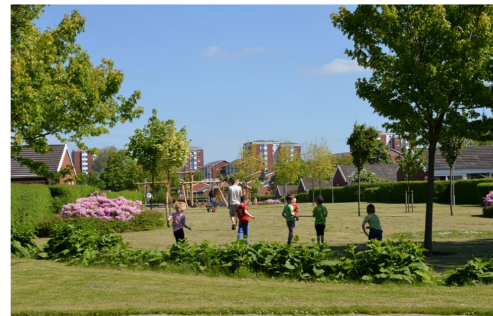
Grønne områder i boligkvartererne gav beboerne et tiltrængt åndehul og et rum for fællesskab. Spangsbjergparken i Esbjerg var tegnet af den unge arkitekt Jens Sottrup-Jensen for Esbjerg Almennyttige Boligselskab og bestod af treetagers blokke, der stod færdige i 1955, punkthøjhuse fra 1955-58 og rækkehuse fra 1959-60.

Med det overordnede tema ”velfærdssamfundets bygningskultur fra perioden 1945-75”, dækker strategien almen bygningskultur, fra en byggeperiode med det største byggeboom, hvorfra størstedelen af den eksisterende bygningsmasse i dag stammer fra, herunder de mere almindelige bygninger så som etagebyggeri, parcelhuse, institutioner og fabrikker, dvs. bygninger som ikke tidligere har været typiske fredningsemner, ikke mindst på grund af kravet om fredede bygningers alder på minimum 50 år. Selv om disse almene bygninger netop afspejler samfundets nyere historie og identitet og giver mulighed for, at alle kan se sig repræsenteret, så kan det blive en udfordring at skabe forståelse for det ”almindeliges” fredningsværdier. Derfor er der behov for, via et formidlingsarbejde, at ændre forventningerne til, hvad der kan fredes i fremtiden. Ved at fokusere på velfærdssamfundets bygningsarv kan dette fokus forhåbentlig skabe et lokalt medejerskab, hvor borgere kan se sig selv repræsenteret, og hvor fredningen gøres til et demokratisk projekt for flere samfundsgrupper, netop fordi velfærdets bygningsarv er en del af vores hverdagsliv.