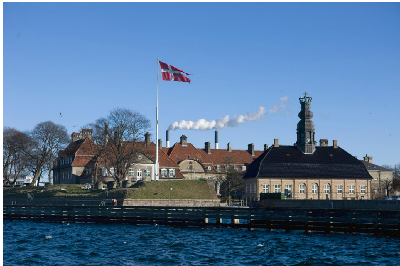
Marinekasernen med administrationsbygningen (1908-10) er fredet sammen med de nære omgivelser. Det samme gælder for Nyholms hovedvagt og Bastionen Sixtus. Det er et smukt eksempel på, hvordan en fredning kan være med til at bevare et enestående kulturmiljø med stærke arkitektoniske værdier.

Nyholm udgør en helt central del af historien om den danske flåde, der gennem 500 år har haft afgørende betydning for Københavns udvikling og samlede fysiske udformning. Den nordligste del af komplekset, Nyholm udgør en umistelig del af Holmen, som fra 1600-tallet og frem til 1992 var flådens hovedbase, med skibsværft, værksteder og magasiner.