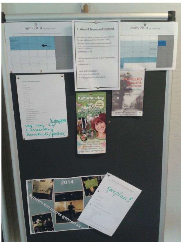
I 8. classes lokaler var projektet altid nærværende på en særlig tavle.

I processen med at udvælge egnede emner til QR-koderne var det bemærkelsesværdigt, at temaet Ung i Randers havde langt den største tilslutning, og at næsten alle elever i denne gruppe havde anden etnisk baggrund end dansk. Det producerede materiale fra Ung i Randers -gruppen havde det mest varierede og kreative udtryk, og gruppen fandt fælles fodslag i, at deres baggrund og interesser blev taget seriøst.