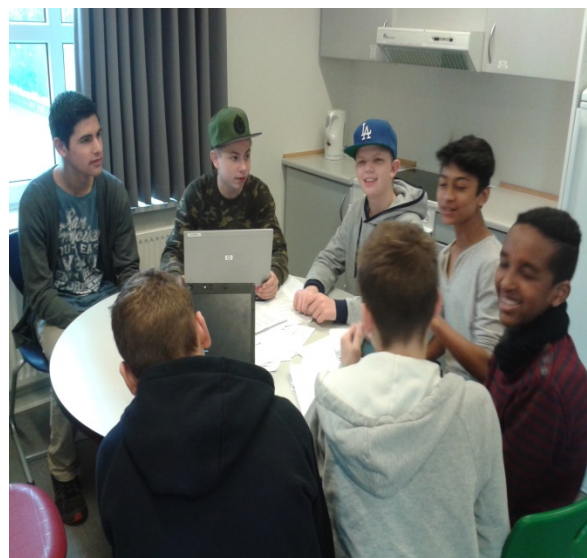
8. klasse på Hadsundvejens Skole og museets medarbejdere fik hurtigt et godt samarbejde. De ungefik nyhedsbreve og fik udleveret mailadresse, som de kunne benytte til spørgsmål og anden hjælp. Ved deres besøg på museet blev de mødt med "voksen-forhold" (mødelokale m. vand, frugt og foldere)