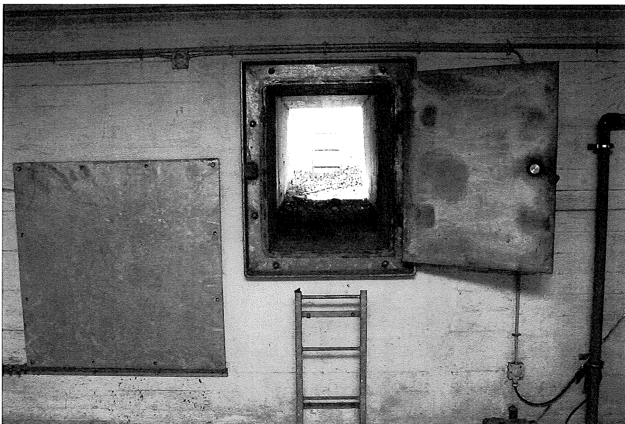
Nøddudgang fra det offentlige beskyttelsesrum under Færø Plads i Aalborg

Hemmelige steder –Koldkrigstidens utilgængelige spor i Nordjylland